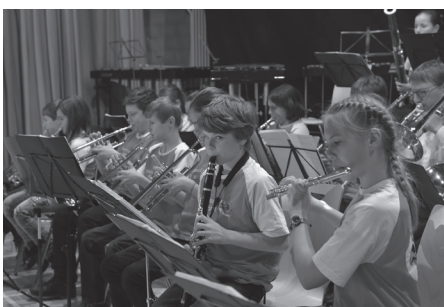
Winterkonzert 2015 Motto «Cirque de la Musique»

Was wir in der ersten Hälfte des diesjährigen Vereinsjahres bereits erlebt haben, können Sie auf den folgenden Seiten lesen. Wir wünschen Ihnen viel Spass dabei.